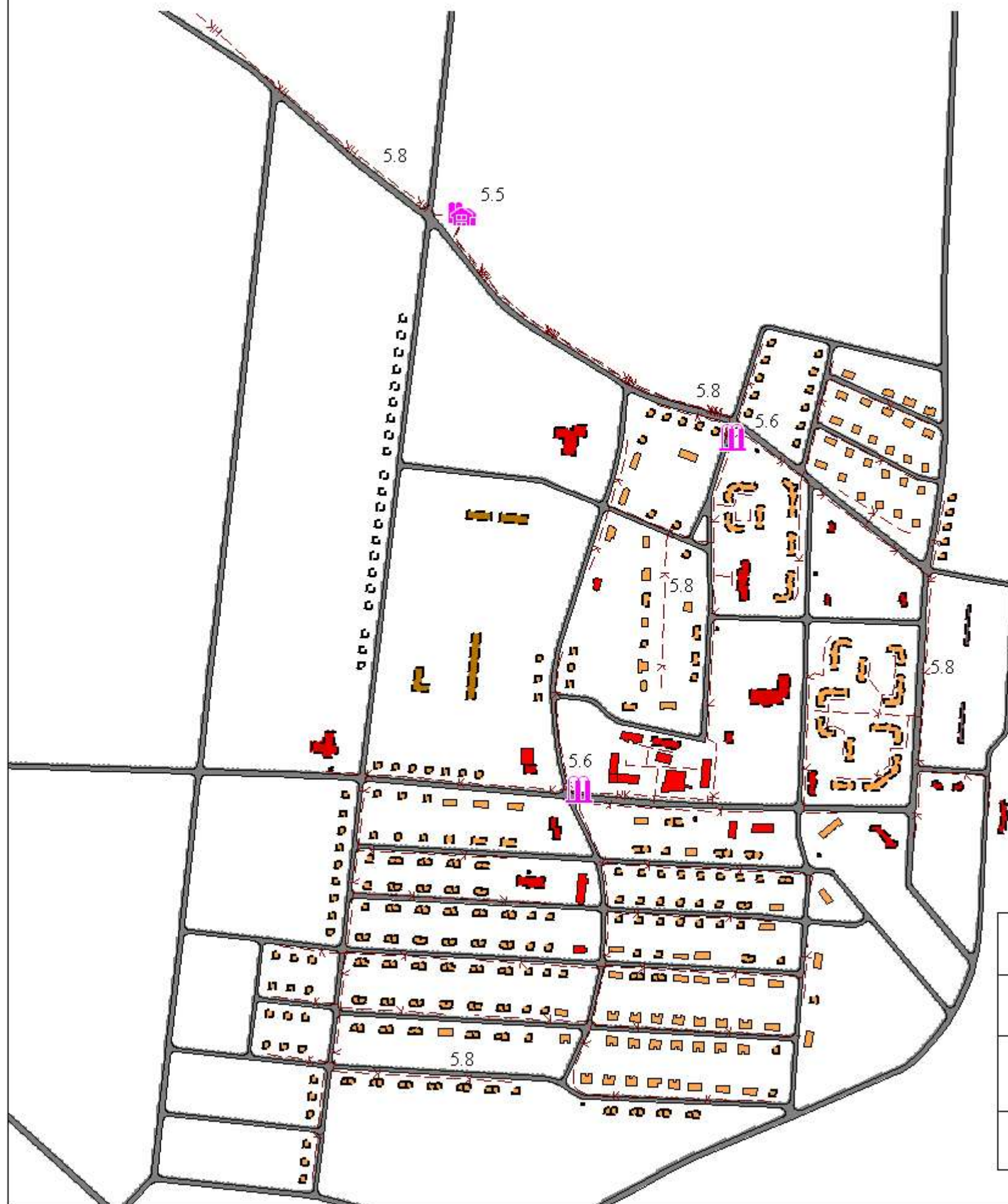
СХЕМА РАЗМЕЩЕНИЯ ОБЪЕКТОВ "ВОДООТВЕДЕНИЯ" ПРЕДУСМОТРЕННЫХ ПЕРЕЧНЕМ МЕРОПРИЯТИЙ ПО ТЕРРИТОРИАЛЬНОМУ ПЛАНИРОВАНИЮ п. СЕРГИНО