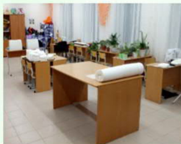
Кабинет трудотерапии, где установлено швейное оборудование, имеются инструменты, материалы для групповых и индивидуальных занятий