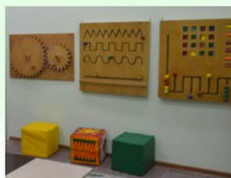
Комната ОКУПАЦИОНАЛЬНОЙ ТЕРАПИИ реабилитация несовершеннолетних, которые по состоянию здоровья нуждаются в помощи при уходе за собой, проведении досуга и выполнении трудовой деятельности