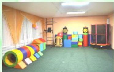
Кабинет ЛЕЧЕБНОЙ ФИЗИЧЕСКОЙ КУЛЬТУРЫ