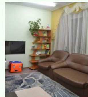
Кабинет профессиональной реабилитации инвалидов